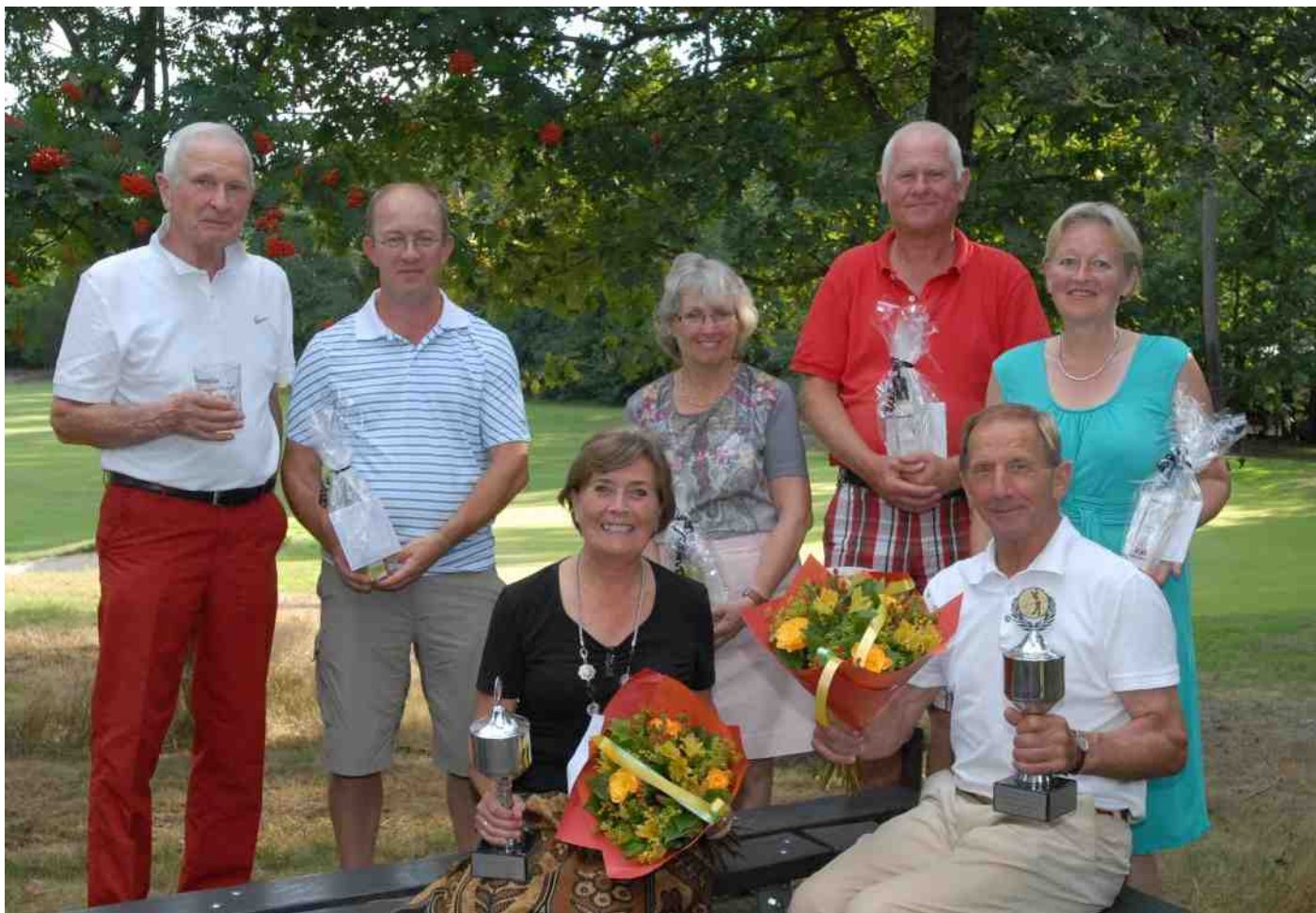
De winnaars van het kampioenschap Strokeplay 2013