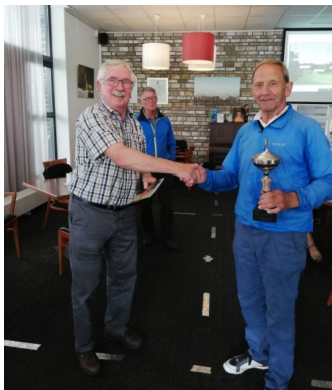
Prijzuitreiking clubkampioenschap Matchplay 2021