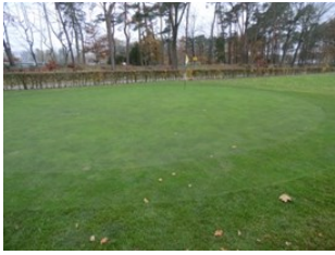
Green hole 8 - december 2022

Zand met hekken eromheen, maar in het voorjaar hebben we een veel uitdagender green op hole 8. Helaas (?) niet meer vlak, maar wel interessanter.